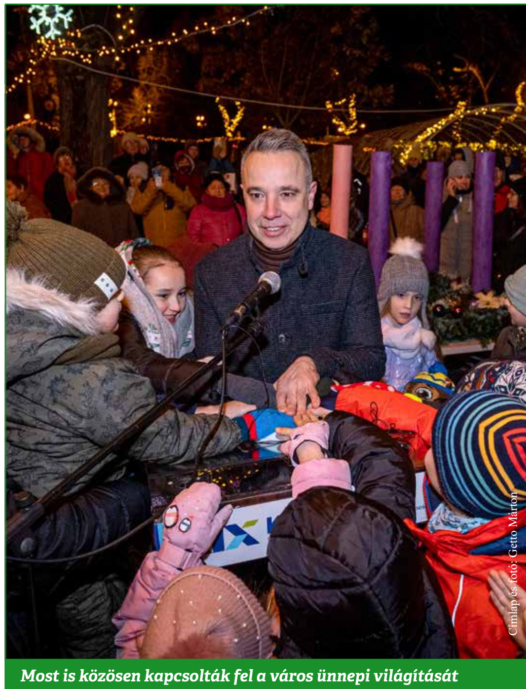
Most is közösen kapcsolják fel a város ünnepi világítását