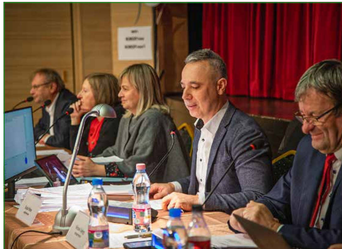
Megemelt, egymillió forintos támogatás a Misszió Alapítványnak

A harmadik „észrevételcsomagban” szerepelt a Skála területe, a KöKi takarításának hiányosságai. A Skála területének több tulajdonosa van, ott nincs önkormányzati terület, a Skála tulajdonosa önkormányzati nyomásra kezdte el a homlokzat felújítását, de az félbemaradt. A KöKi-n kaotikusak a tulajdonviszonyok, a Puskás-szobornál lévő rész az önkormányzaté, azt rendben tartják.