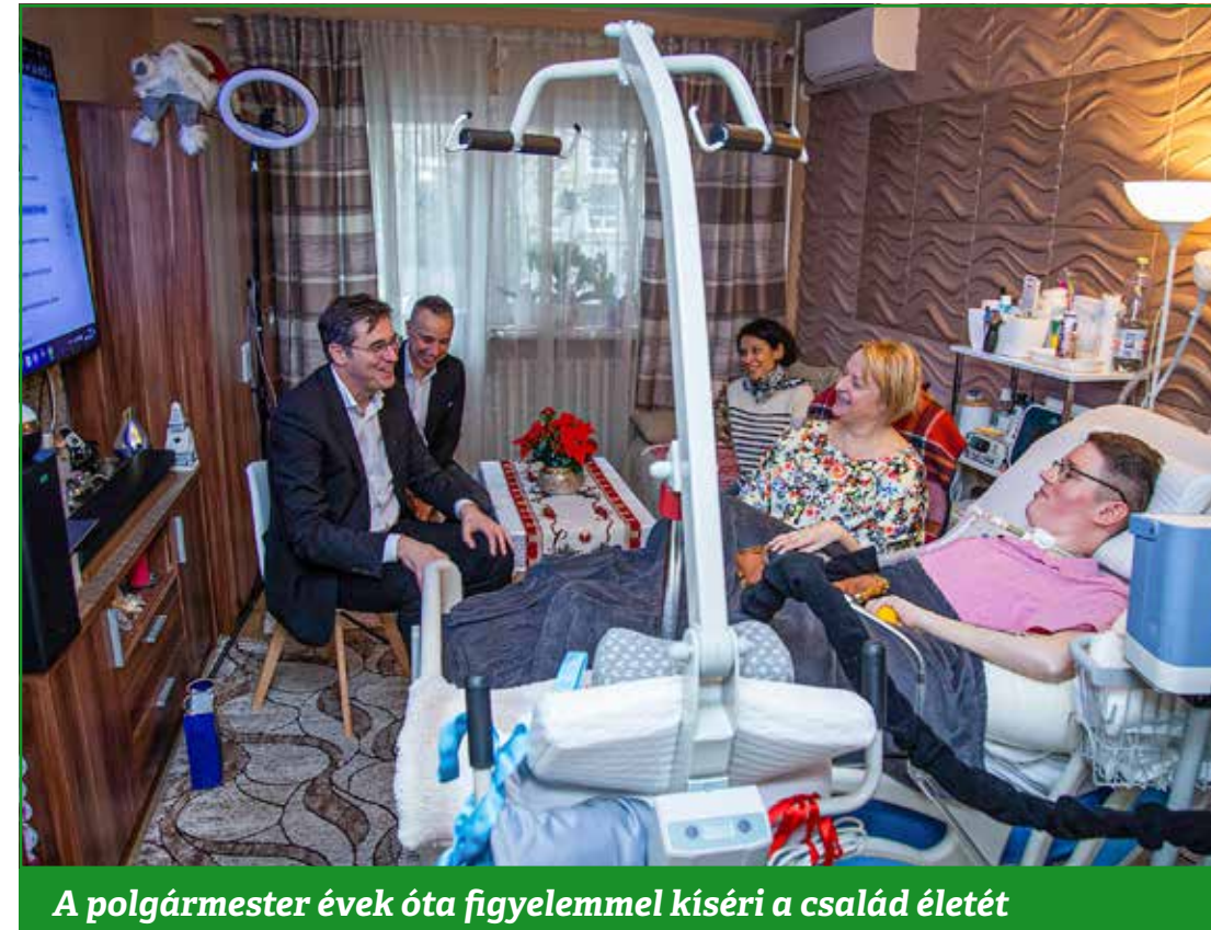
A polgármester évek óta figyelemmel kíséri a család életét

Alapos összefoglaló hallgathattak a generációk médiahasználatáról az érdeklődők Dr. Guld Ádám médiakutató, kommunikációs szakembertől. Előadásának középpontjában a Z-generáció (13–27) és annak médiafüggősége állt.