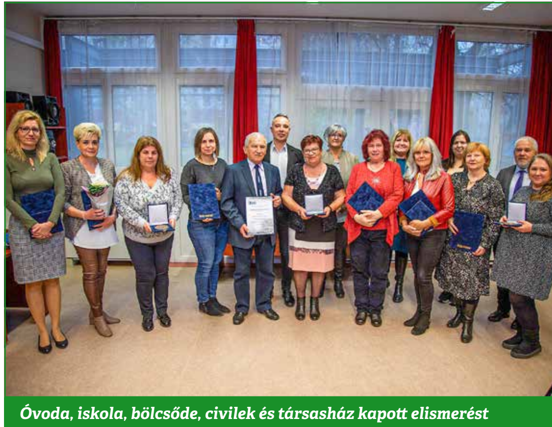
Óvoda, iskola, bölcsőde, civilek és társasház kapott elismerést

A téli madáretetés körüli teendők bemutatásával folytatódott az önkormányzat és a Közpark Kft. közös, „Kispest Kis Kertésze Vagyok” programja. Ez alkalommal, az Arnyas óvoda nagycsoportos óvodásai segítségével madáretetőket helyeztek ki a Kós Károly térre. Az eseményen megismertették a gyerekekkel a téli madáretetés legfontosabb alapelveit, tudnivalóit, eszközeit, és megkapták a városi énekesmadarak lerajzolt változataiból összeállított színezőket, melyek segítik a madarak beazonosítását, nevük megtanulását.