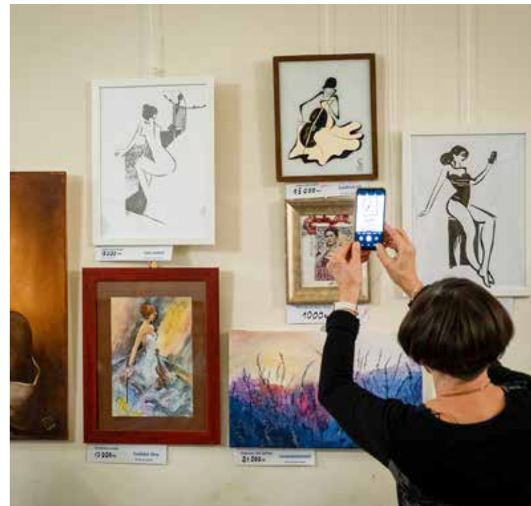
Tizenöten összefogtak, segítettek

mista vagyok a jövő tekintetében – tette hozzá. Egy város életében a három legfontosabb tennivaló között szerepel a közbiztonság, amelyre a jövő évi költségvetésben több forrást biztosít az önkormányzat. Ennek köszönhetően nagyobb lesz a közterületi jelenlét és az összefogás a kerület közbiztonságáért dolgozók, a rendőrség, a kerületi rendészet és a polgárőrség között – mondta a polgármester.