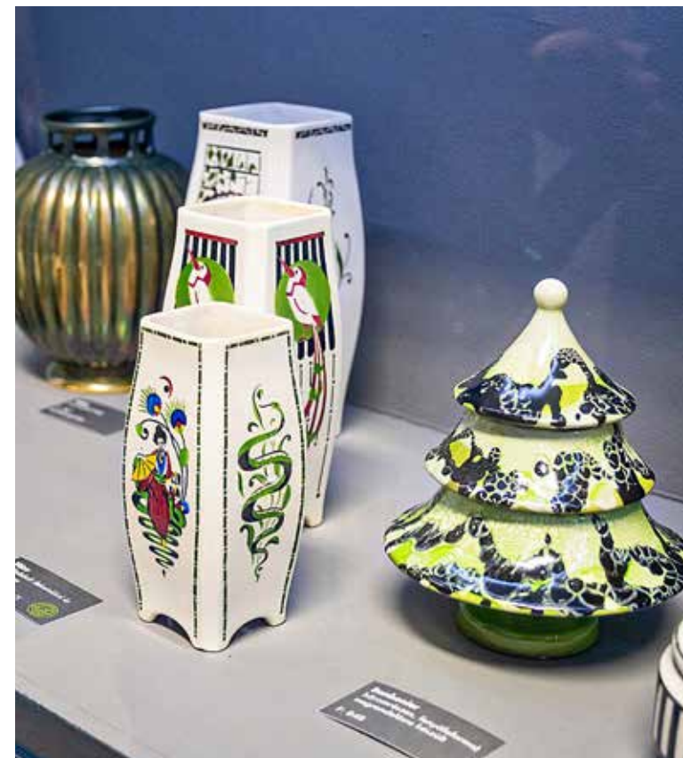
A fiatal lányt a tömeggyártás érdekelte, hogy amit készít, sok emberhez eljusson

(Kispesti Vass Lajos Általános Iskola). Az intézmény 2011 óta viseli az Örökös Ókoiskola címet. 2023-ban iskolájukban rovarhotel is létesült, mely tevékenységeikkel összhangban közelebb hozza a természetet tanulóikhoz. Polgármesteri különdíjat vehetett át a Kispesti Bolyai János Általános Iskola Alapítványa. Egyes programjait a közösség építése céljából a lakosság részére is nyilvánossá tették. 2021-ben elnyerték az Örökös Ókoiskola címet. Több éve tevékeny az ökomunkacsoportjuk és ökoszakkörük. Korábbi tevékenységüket mostani pályázatukkal szeretnék tovább bővíteni.