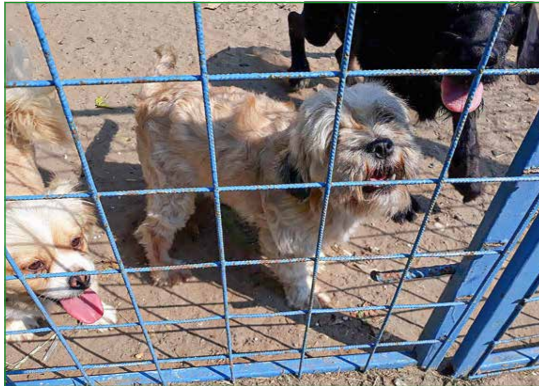
A Luca Kutyamenedékben több mint száz kutya vár szerető gazdára

„A legnagyobb munkát az Üllői út jelentette: több mint 360 új facsemetét ültettünk vissza – közel 50-nel többet, mint amennyit eltávolítottunk. Ráadásul, ahol volt erre lehetőségünk, ott igyekeztünk a korábban az Üllői úton többnyire jellemző gömbakácokat (Robinia pseudoacacia 'Globosa') ökológiailag értékeesebb és dekoratívabb fákra cserélni, például oszlopos gyertyánra (Carpinus betulus 'Fastigiata'), vagy gömbnövekedésű cseleszmegegyre (Prunus fruticosa 'Globosa')” olvashattuk a fővárosi társaság, a Főkert hivatalos oldalán.