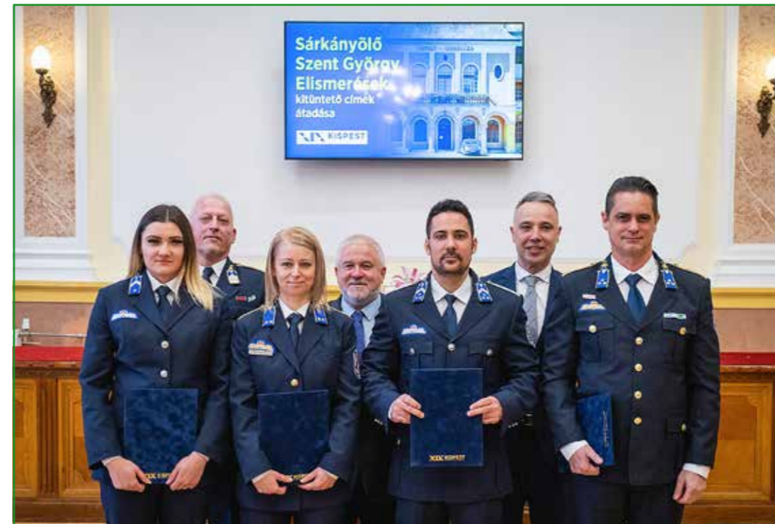
A cél, hogy Kispest Budapest legbiztonságosabb kerülete legyen