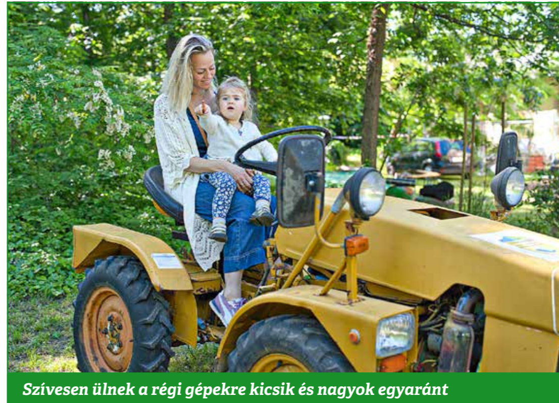
Szívesen ülnek a régi gépekre kicsik és nagyok egyaránt

A polgármester, a nagykövet és a Maarif igazgatója együtt leplezték le az ajándékozásnak emléket állító táblákat, majd az óvodások magyar népdalokkal és török dallal köszöntötték a vendégeket.