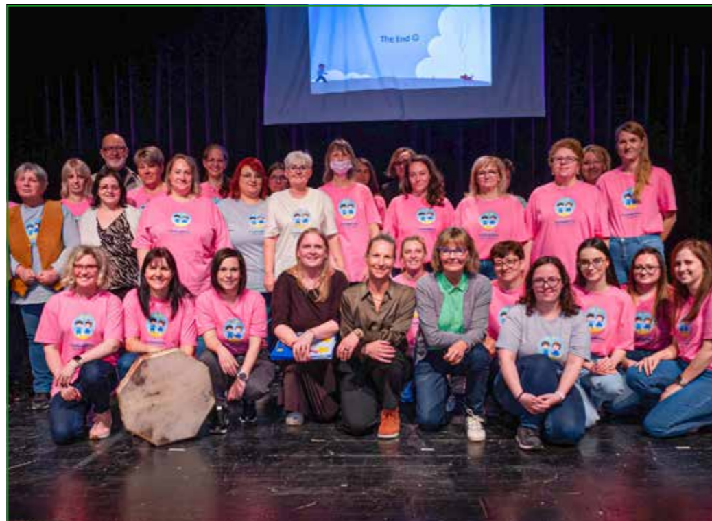
A résztvevők színpadi mesével mondtak köszönetet a dánoknak

A kerítés építésével megkezdődött az ötödik kispesti közösségi kert kialakítása a Toldy utca és a Kazinczy utca közötti parkban. A helyszínről tavaly októberben tartottak közösségi tervezési fórumot. A tervek szerint május végén már nyit a mintegy 600 négyzetméteres, 24 magaságúas kert. A kerítést, a magaságúasokat, a vízvételi lehetőséget az önkormányzat biztosítja. A kert és a közösség kialakítása azonban a kertészek feladata lesz. A közösség építésében – mint a többi kert esetében – most is Rosta Gábor segíti majd a lakókat.